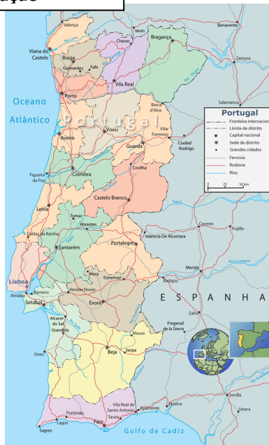
Distritos de Portugal