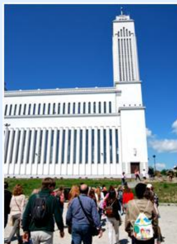
Igreja de Kaunas (usada como fábrica de rádios durante a ocupação russa)