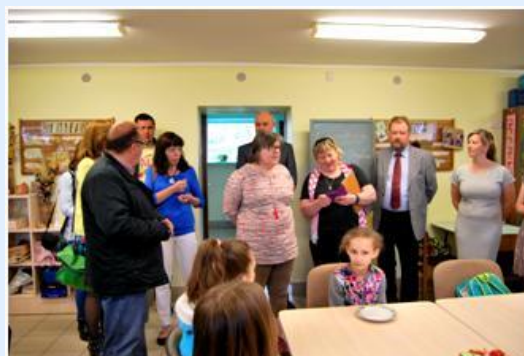
Visitas às salas de aula