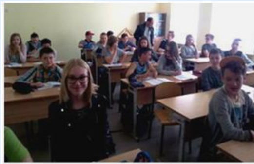
Uma sala de aula

Esta viagem ofereceu experiências educacionais muito ricas, permitindo o desenvolvimento de conhecimentos de diversas áreas disciplinares, tais como a Matemática, a Biologia, a História e as Artes, assim como o Inglês. No final, sobressaiu o exemplar desempenho dos nossos alunos na partilha de saberes e na comunicação com os outros alunos, num ambiente fraterno de sã convivência.