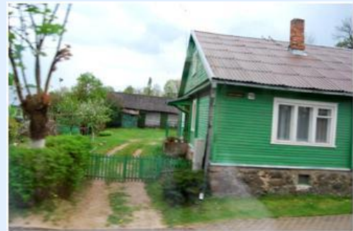
Casa na Lituânia