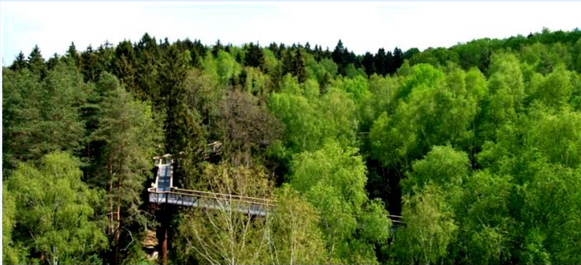
Caminho na copa das árvores em Anykščiai