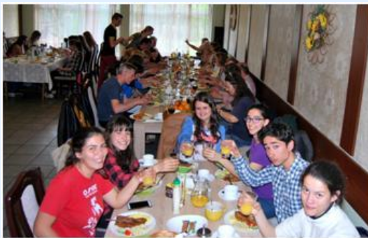
Almoços de confraternização