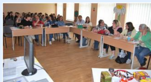
Reuniões de apresentação e de avaliação das atividades do projeto Our Forest Our Future