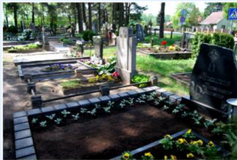
Cemitério de Kazlu Rudos