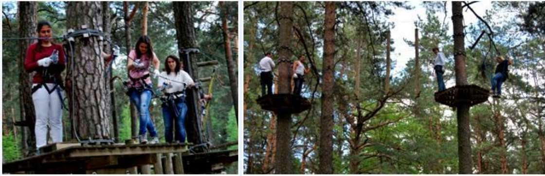
Atividades no Parque Rope, o Parque Radical de Kazlu Rudos