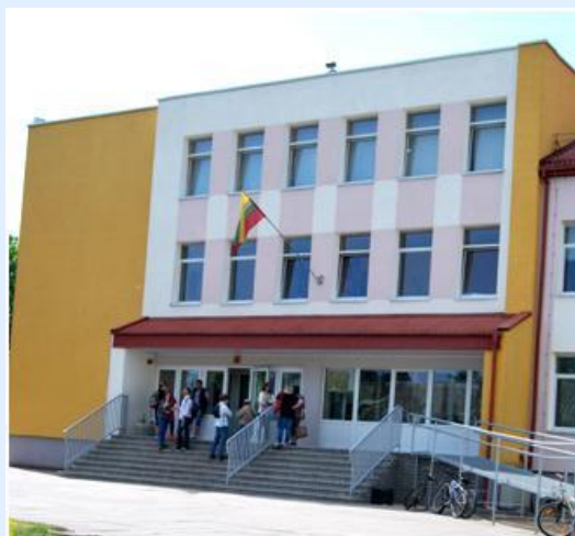
Escola Kazlu Rudos Pagrindinė Mokykla

As visitas a lugares e monumentos da região permitiram reconhecer aspetos essenciais da História, da Botânica e da Cultura da Lituânia. Destaca-se a floresta de Kazlu Rudos, a típica localidade de Anykščiai e o esplendoroso museu zoológico em Kaunas.