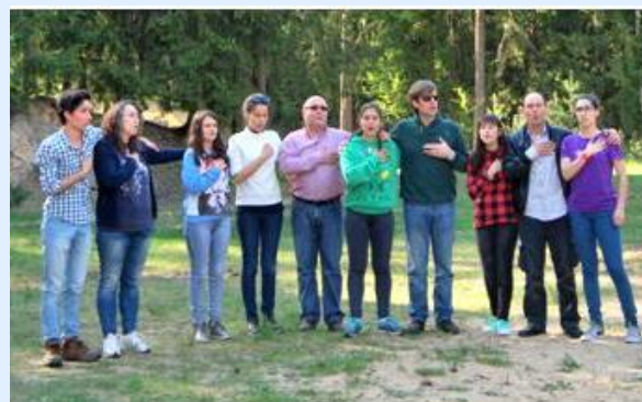
Atividades na Floresta de Kazlu Rudos