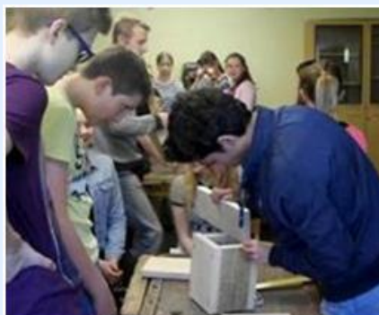
Construção de casas de pássaros