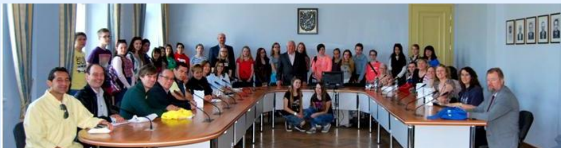
Receção na Câmara Municipal de Kazlu Rudos