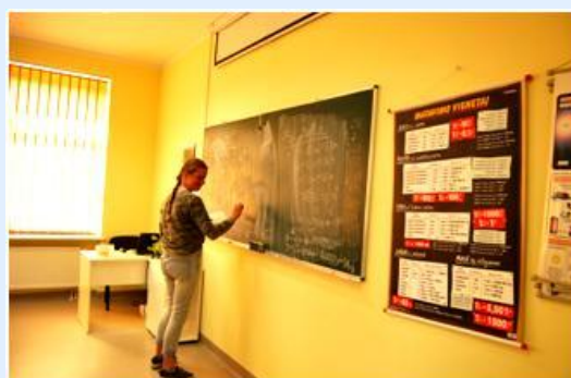
Aluna no quadro a giz