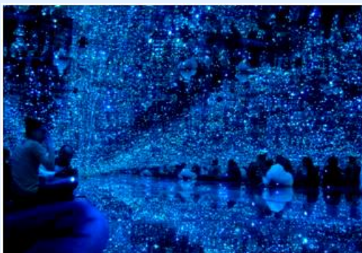
Cosmos "Milky Way" em Anykščiai