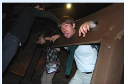
Masmorra do Castelo de Kaunas