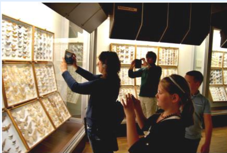
Museu Zoológico de Kaunas