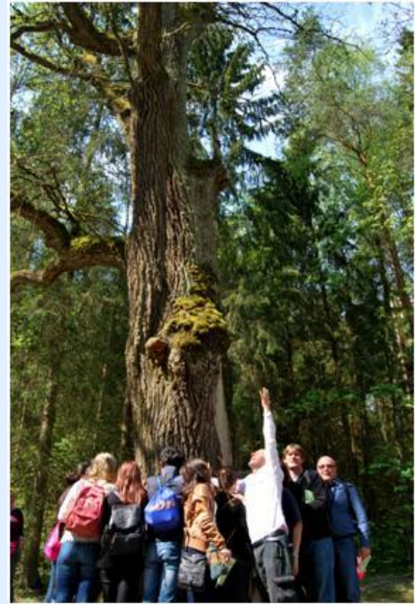
Abraçar uma árvore é comunicar com os deuses