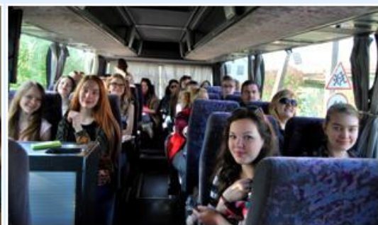
Viagens em grupo