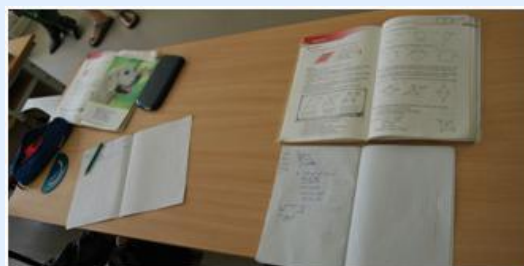
Livro e caderno de matemática