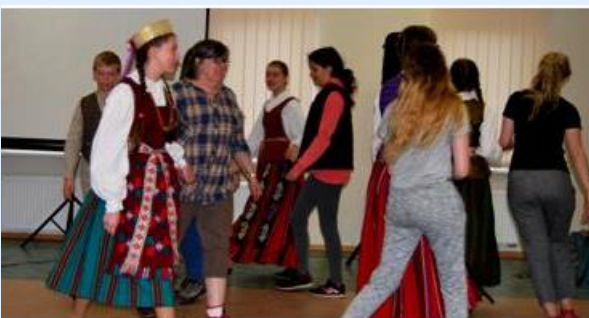
Espectáculo apresentado por estudantes locais