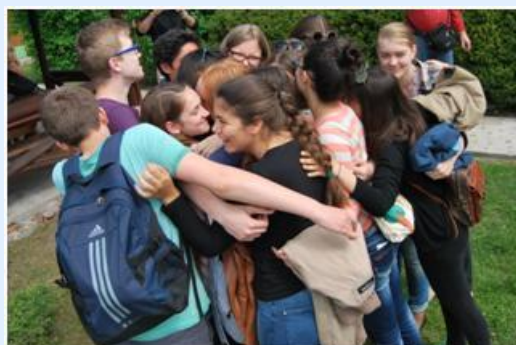
A despedida difícil