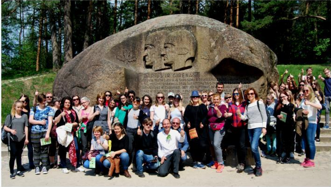
Participantes do Projeto Our Forest Our Future junto da segunda maior pedra da Lituânia