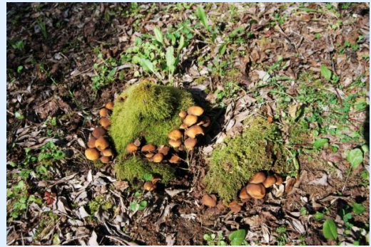
A Caminhada das Medas até à Fraga de S. Miguel